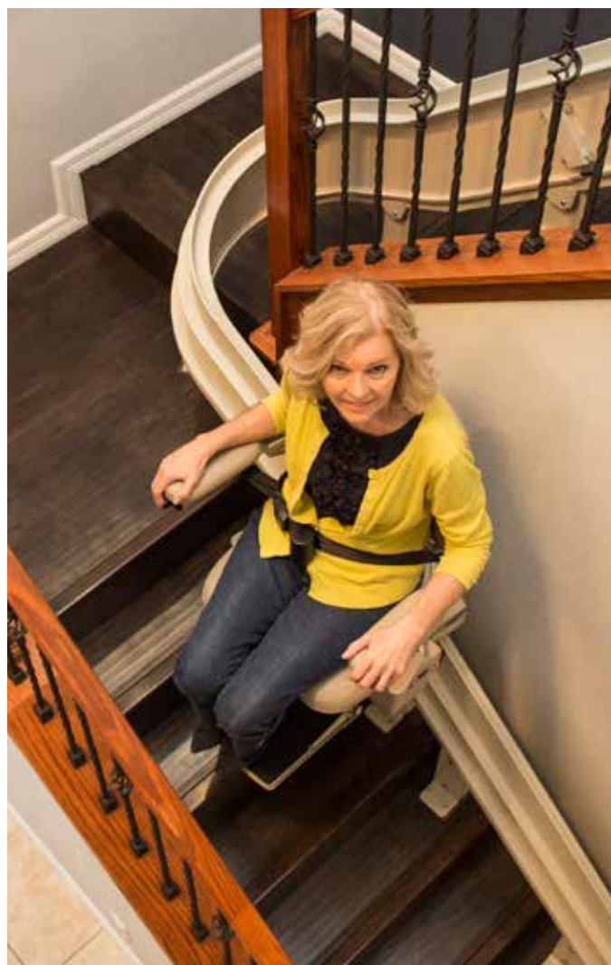
Diseñado para un ajuste preciso alrededor de las curvas.