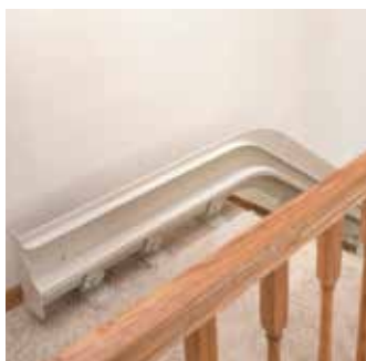
Parque superior o inferior la posición extiende el riel de la escalera