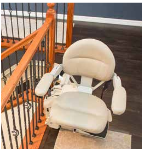
El asiento giratorio desplazado lo hace Fácil de cargar / descargar.