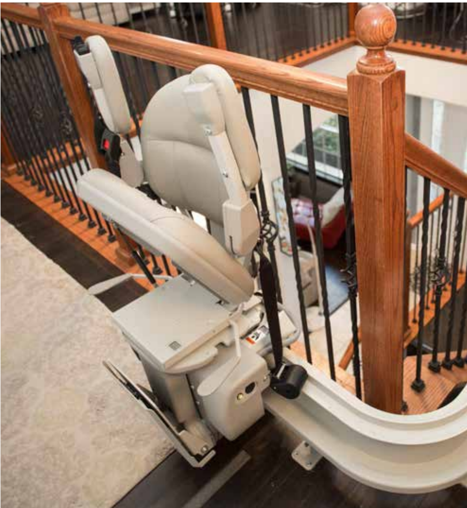
Hecho a medida específicamente para su hogar.