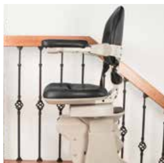
Asiento giratorio eléctrico. Control en el reposabra- zos de la silla o llamada / envío inalámbrico.