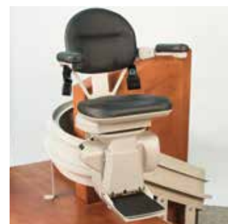
Mid-park y carga estación para escaleras con aterrizajes medios.