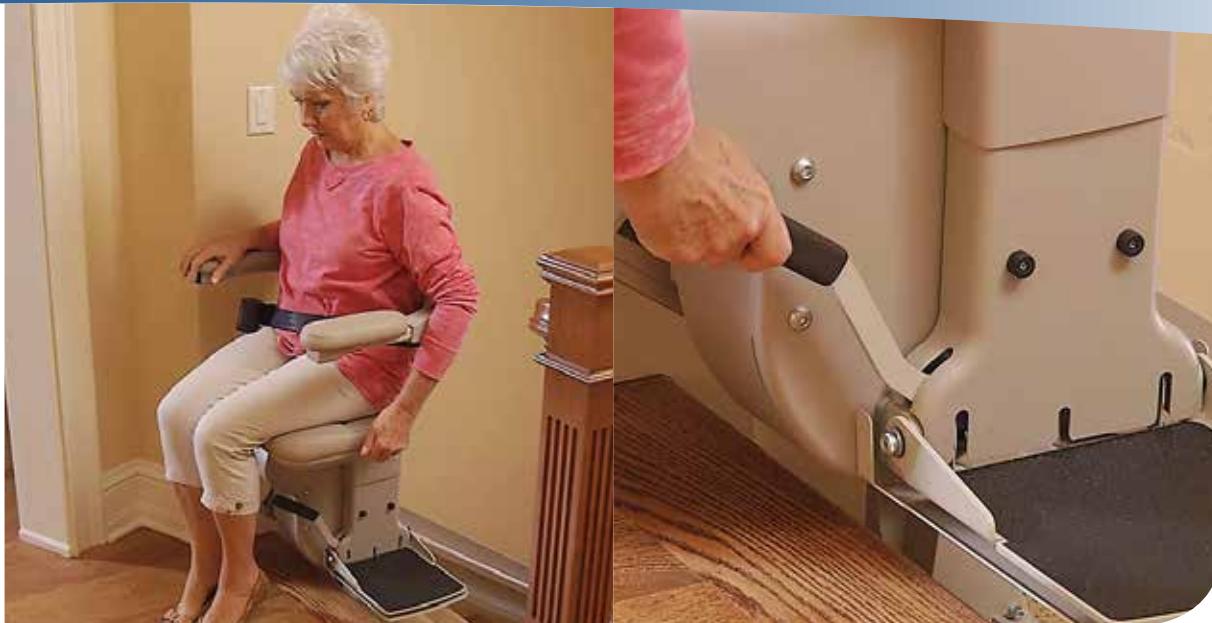
Le siège à pivot décalé facilite l'accès.