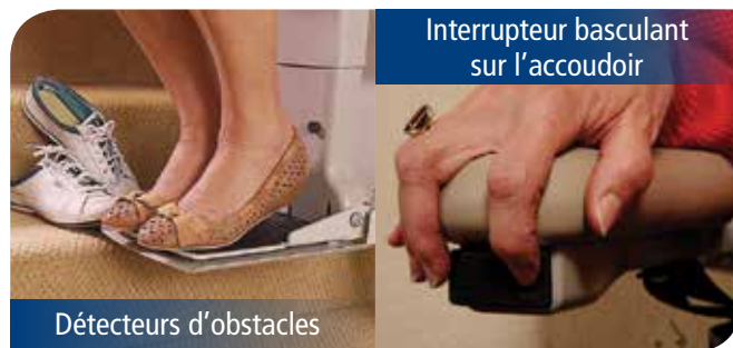
Interrupteur basculant sur l'accouider