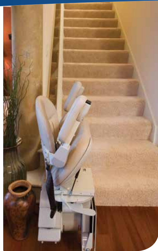
Installation contre le mur.

Pour en savoir plus, rendez-vous sur www.bruno.com